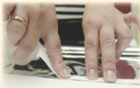
3. Plak het meegeleverde dubbelzijdig tape op de rand van de HR-radiatorfolie.