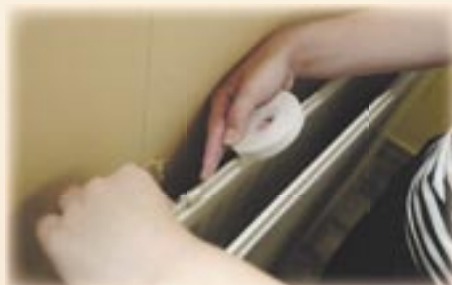
6. Plak het dubbelzijdig tape op de bovenrand van de radiator.