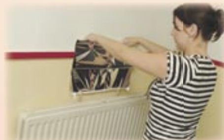
8. Verzwaar de onderkant van de folie met enkele wasknijpers en laat de folie achter de radiator zakken.