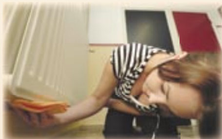
5. Maak aan de achterkant van de radiator de randen schoon.