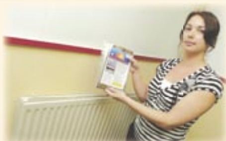
2. De HR-radiatorfolie moet aan de achterzijde van de radiator worden bevestigd.