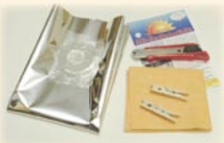
1. Benodigd gereedschap: Stanleymes, wasknijpers en schoonmaakdoekje.

Zo maakt u eenvoudig van uw LAAG RENDEMENT radiator een HOOG RENDEMENT radiator!