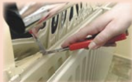
11. Snij met een scherp mes de folie af en doe vervolgens de volgende baan.